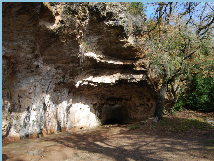
Foto: La Surgència. Parc Prehistòric de les Coves del Toll. Autor: Museu de Mojà